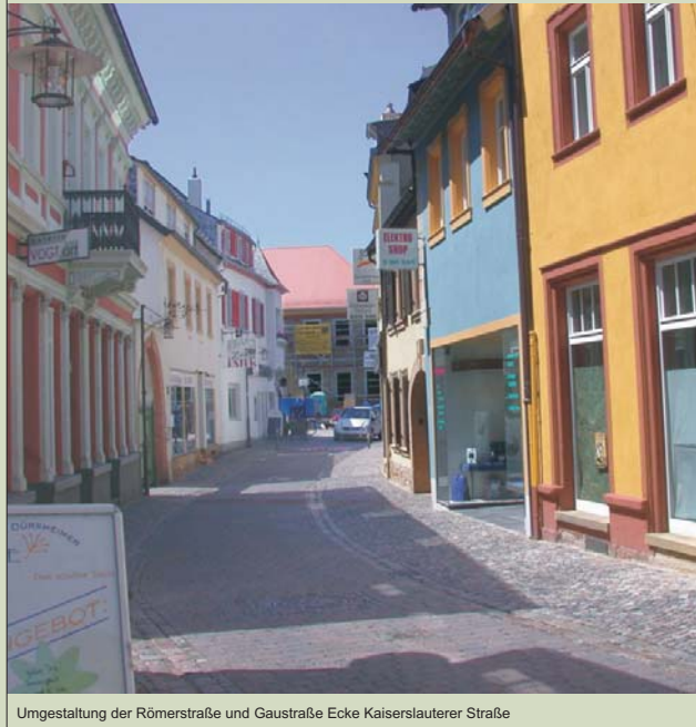
Umgestaltung der Römerstraße und Gaustraße Ecke Kaiserslauterer Straße