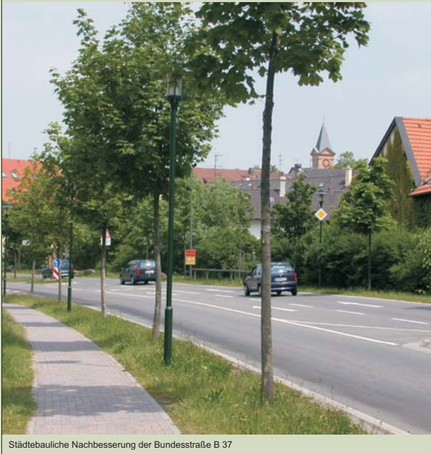
Städtebauliche Nachbesserung der Bundesstraße B 37