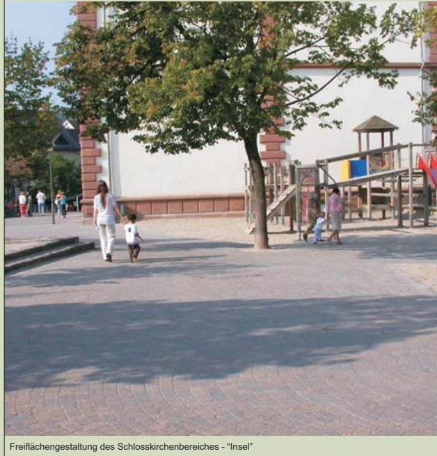
Freiflächengestaltung des Schlosskirchenbereiches - "Insel"