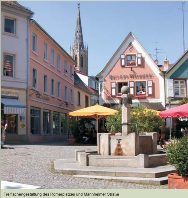
Freiflächengestaltung des Römerplatzes und Mannheimer Straße