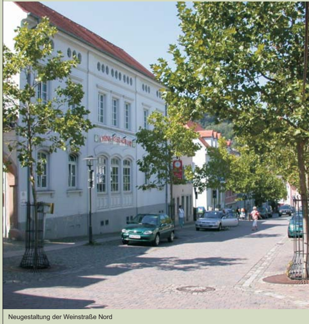
Neugestaltung der Weinstraße Nord