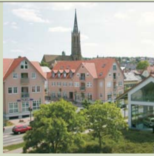
Neugestaltung der Stadteinfahrt - Bereich Torgebäude