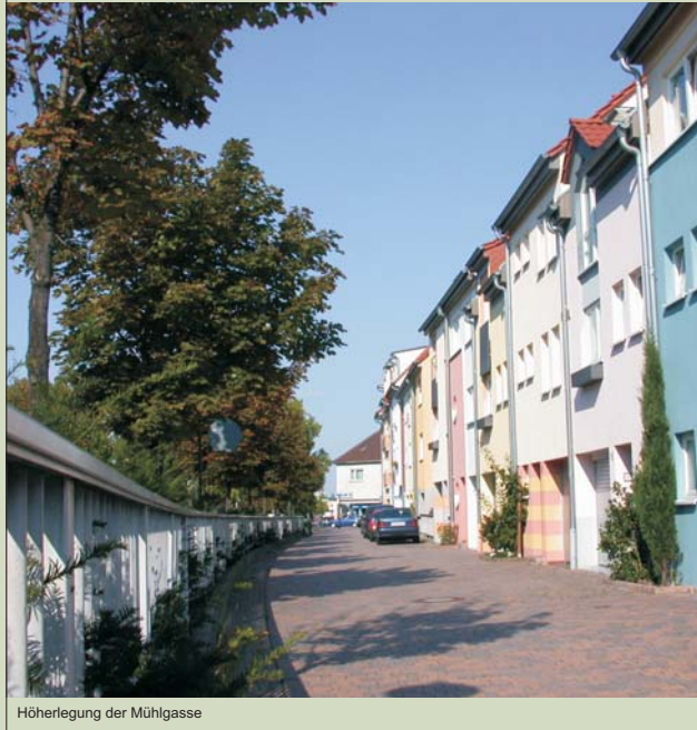
Höherlegung der Mühlgasse