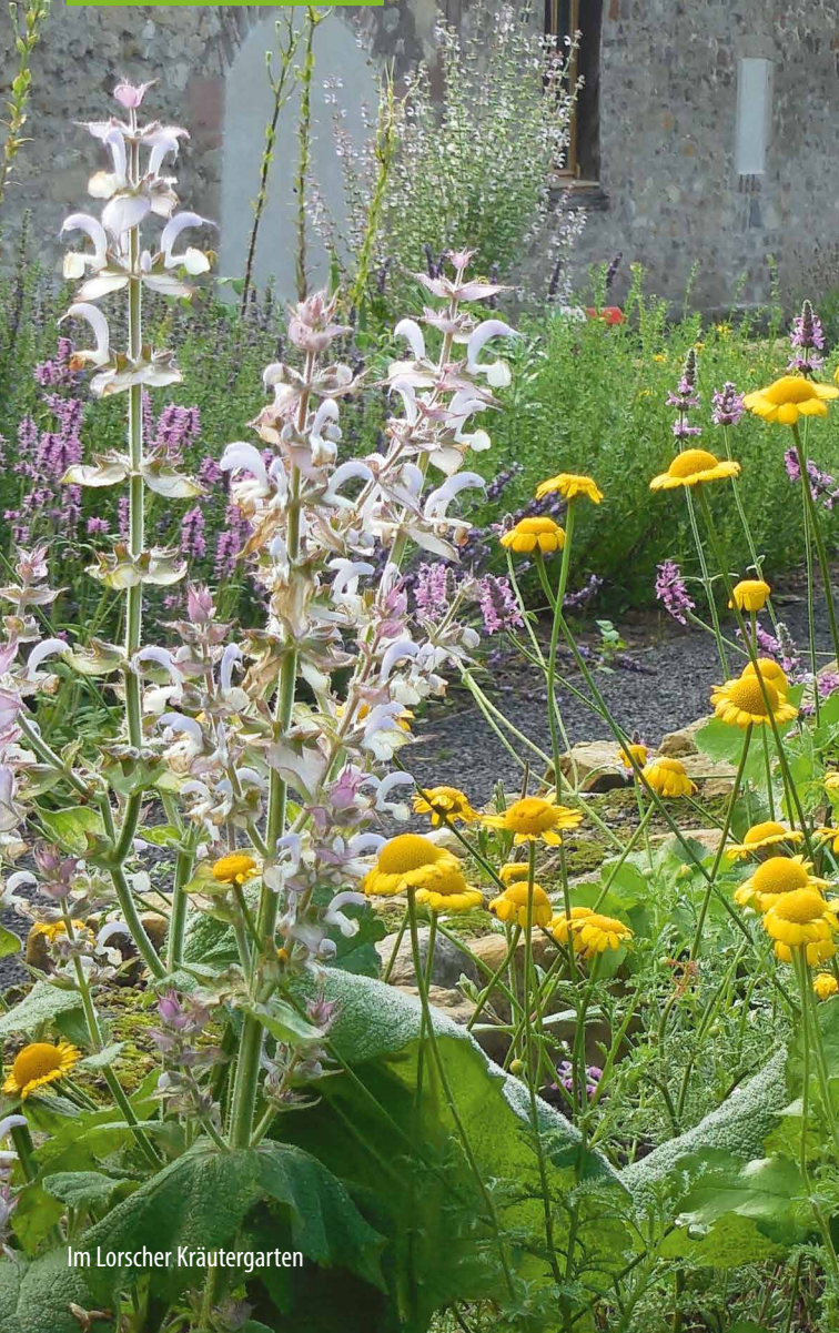
Im Lorscheer Kräutergarten