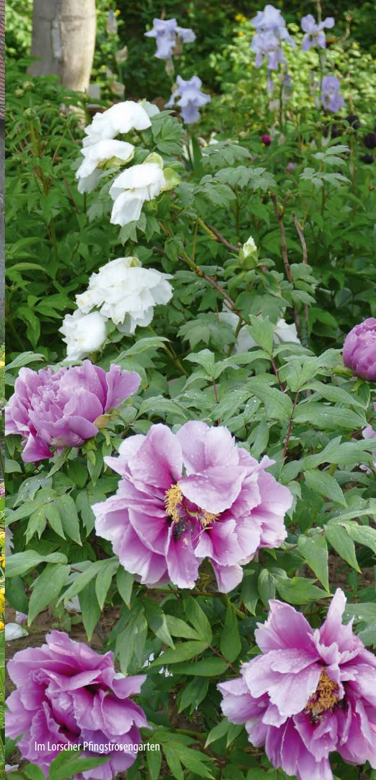
Im Lorscheer Pfingstrosengarten