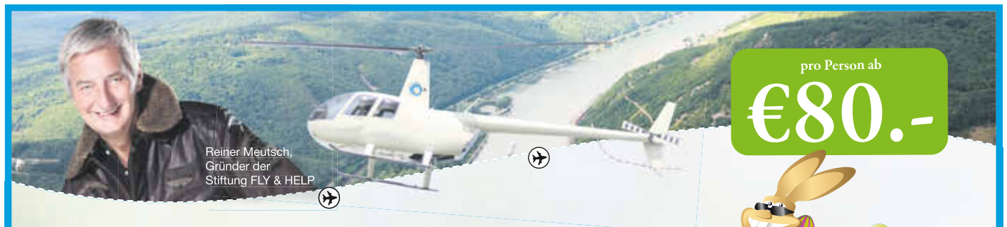
Reiner Meutsch, Gründer der Stiftung FLY & HELP