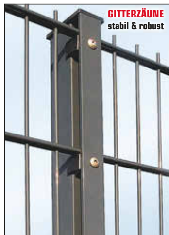
GITTERZÄUNE stabil & robust

Sichtschutz für jeden Bedarf aus Aluminium, WPC, Glas und Holz Gittersteinwände, Gitterzäune und Tore