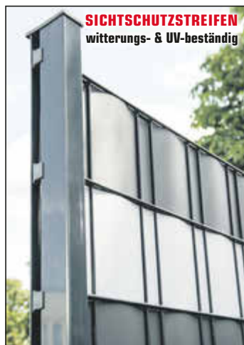
SICHTSCHUTZSTREIFEN witterungs- & UV-beständig

Wer sein Grundstück oder die Terrasse im pflegeleichten oder mediterranen Stil gestalten möchte, findet im HILA Fachhandelszentrum ideale und anspruchsvolle Lösungen. WPC-Sichtschutz, Holz- oder ALU-Elemente kombiniert mit außergewöhnlichen Designelementen aus ALU, Edelstahl, Cortenstahl (Rostoptik), Gabionen oder Glas können individuelle Akzente gesetzt werden.