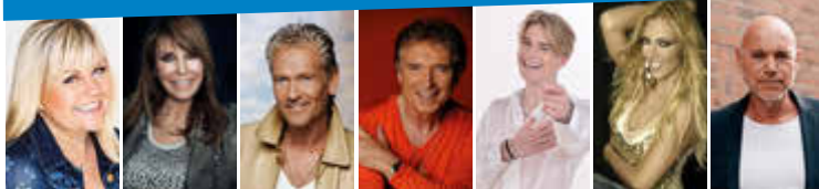
Gaby Baginsky, Ireen Sheer, Olaf Berger, Peter Orloff, Vincent Gross, Loona und Olaf Henning