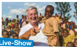
Live-Show mit Reiner Meutsch