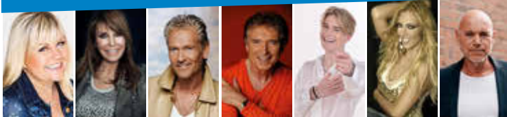
Gaby Baginsky, Ireen Sheer, Olaf Berger, Peter Orloff, Vincent Gross, Loona und Olaf Henning