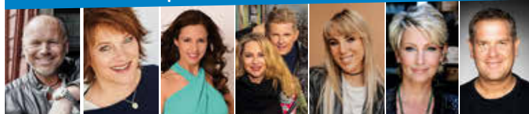
Olaf Henning, Nicki, Anita Hofmann, Markus & Yvonne, Annemarie Eilfeld, Claudia Jung und Peter Wackel

Weitere Infos unter: www.schlager-kanaren.de