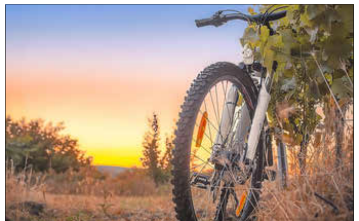
Siegerfoto des Fotowettbewerbs

Beim Fotowettbewerb hat Alexander Bauß mit seiner stimmungsvollen Aufnahme von einem Fahrrad neben einer Weinbergszeile vor farbenprächtigem Himmel gewonnen. Sein Siegerfoto wird im kommenden Jahr auf den Flyern und Stadtradeln-Plakaten des Landkreises zu sehen sein.